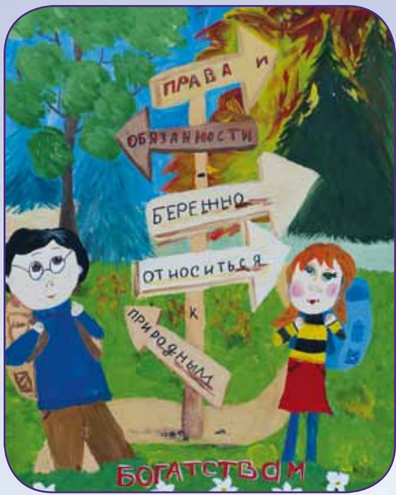
«Права и обязанности – бережно относиться к природным богатствам» Соломянная Алеся, 10 лет, г. Изобильный