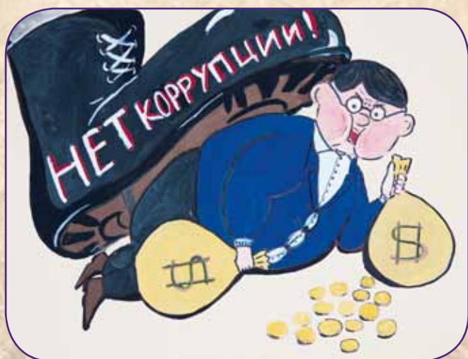
«Нет коррупции» Кузнецов Глеб, 13 лет, ст. Курская