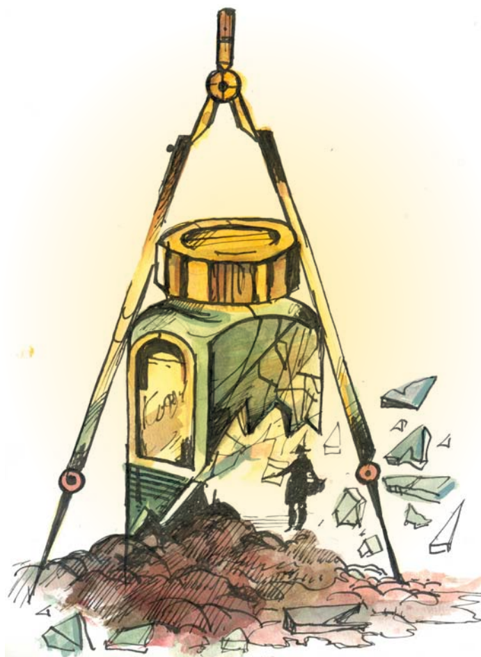
Иллюстрация Евгения Синчинова