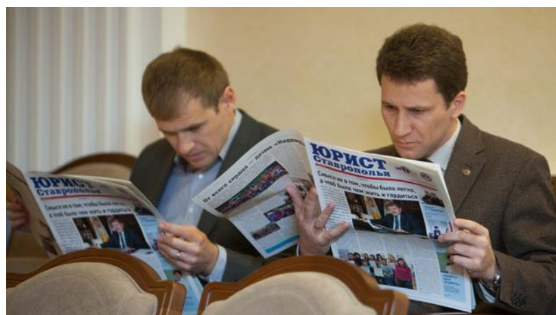
...а юристы читают «ЮС»

Текст Елены Гончаровой