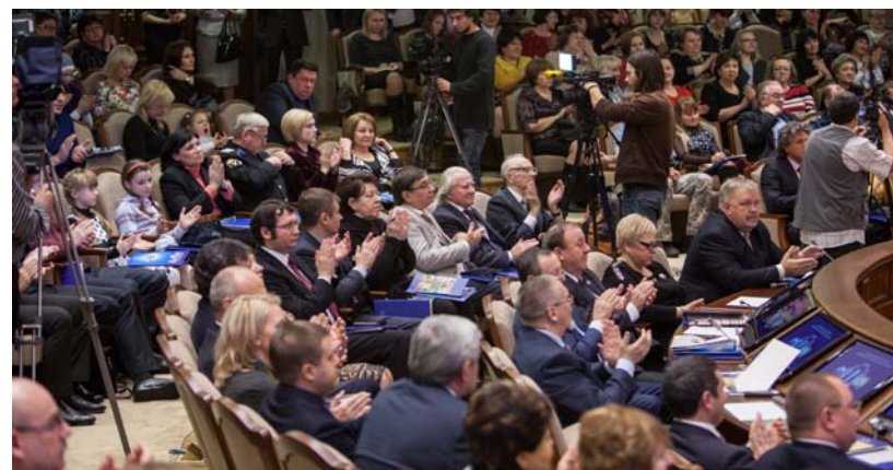
Гостей на празднике много

сти губернатора Ставропольского края Владимир Владимиров, главный федеральный инспектор аппарата полномочного представителя Президента Российской Федерации в Северо-Кавказском федеральном округе по Ставропольскому краю