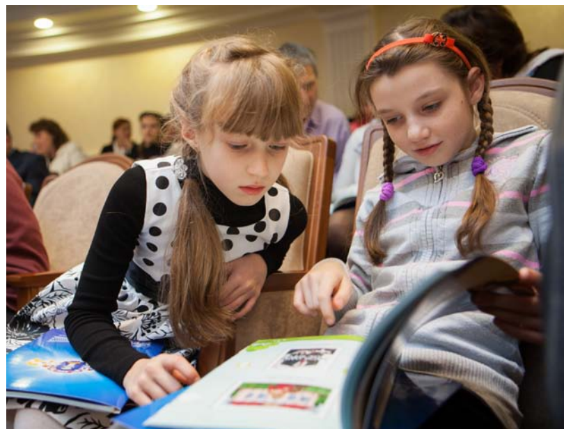
Дети рассматривают рисунки на правовую тематику...