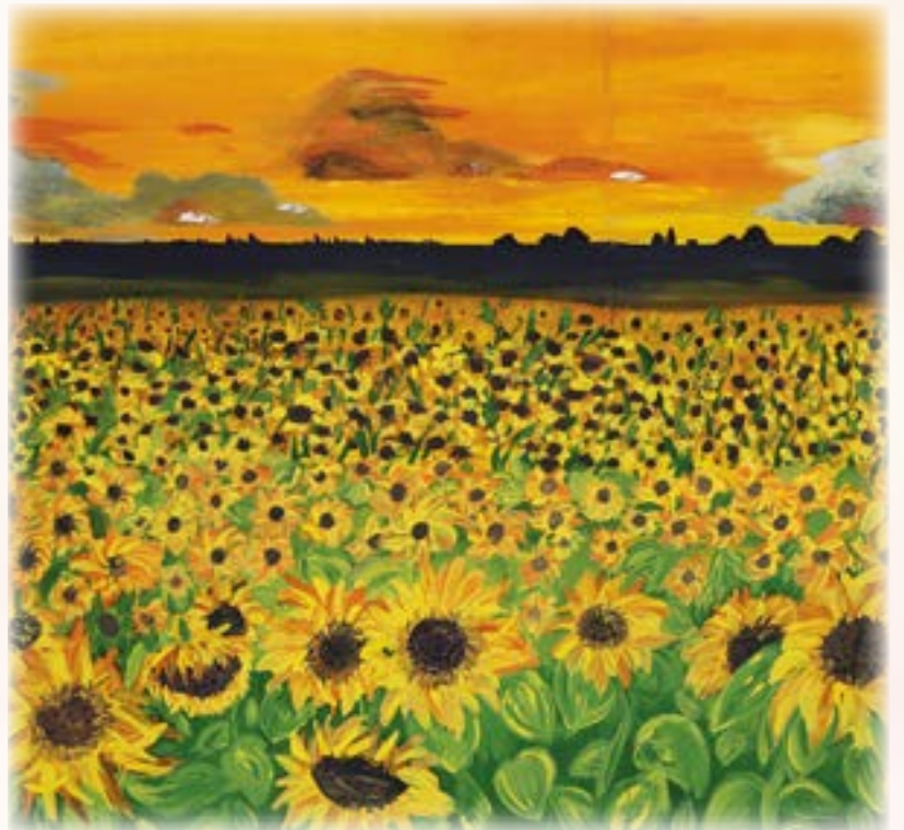
«Люблю я вас, мои просторы», Полина Карташова, 13 лет, с. Высоцкое